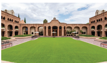
Hilton Hacienda San Luis Potosí