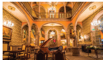
Hotel Museo Palacio de San Agustín