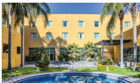
Hotel Fiesta Americana (Hotel sede del evento)